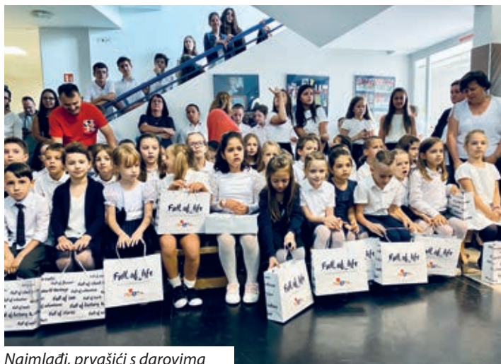
Najmlađi, prvašići s darovima