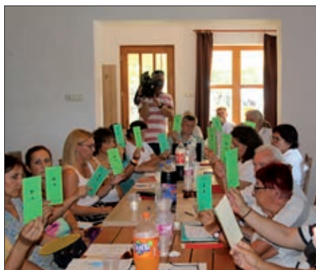
Izvanredna skupština HDS-a