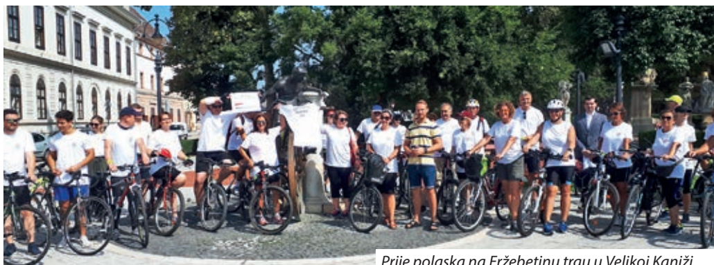
Prije polaska na Eržebetinu trgu u Velikoj Kaniži