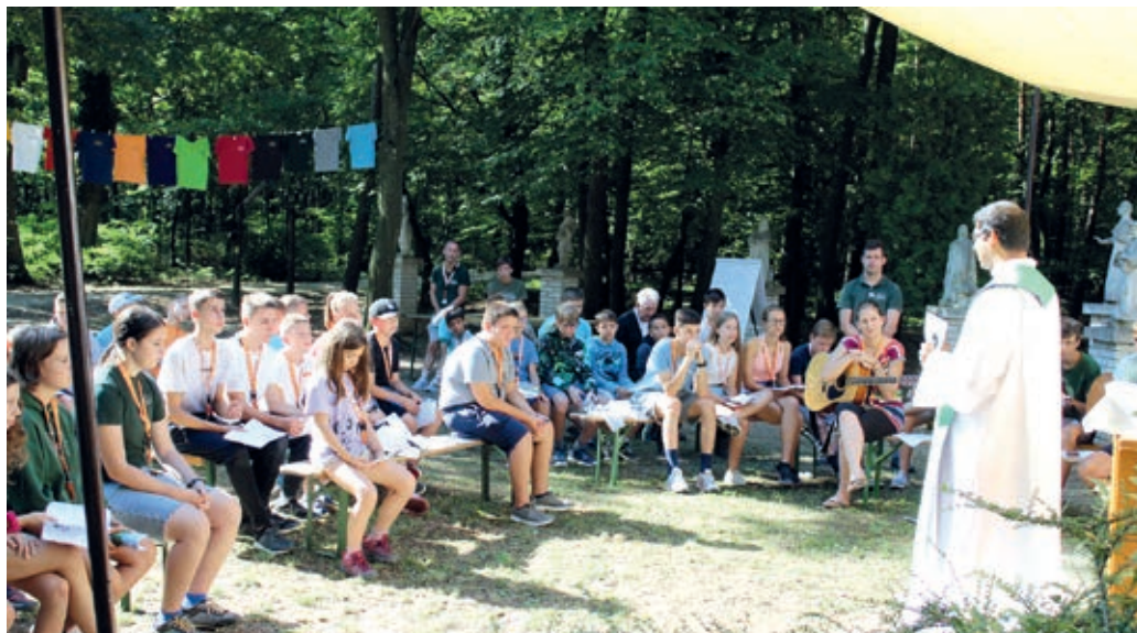
Pri svetoj maši u taboru

Taborske okolnosti već svaki dobro poznaje: doma je ostavno sve ča je suvišno, otpušćamo sve uređjaje i aparate ki nam značu luksuz zato da bar jedan tajedan