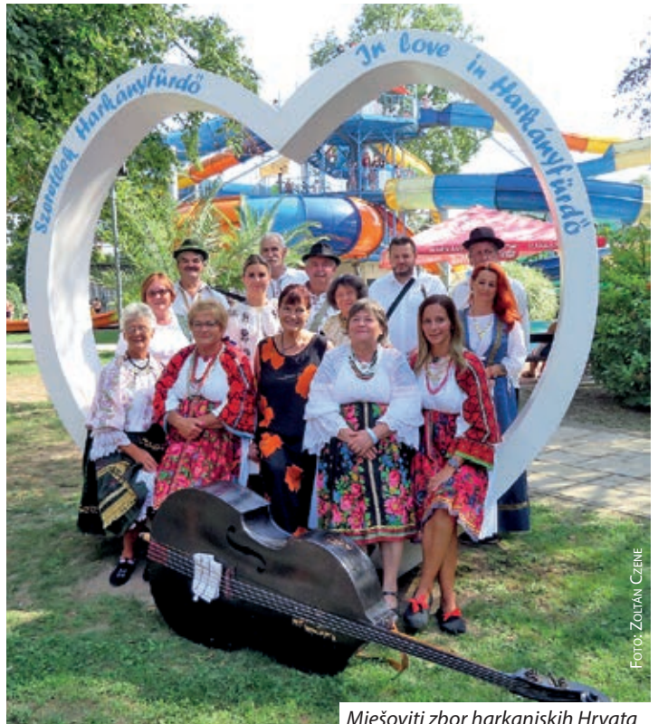
Mješoviti zbor harkanjskih Hrvata

Mješoviti pjevački zbor Harkanja i ove je godine sudjelovao na programima trodnevnog harkanjskog Berbenog festivala.