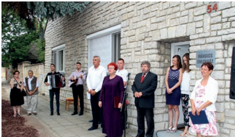
Svečanost je održana ispred obiteljske kuće u ulici Jánoša Aranya pod brojem 54.