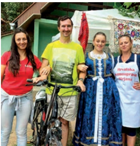
Garci u Gajiću