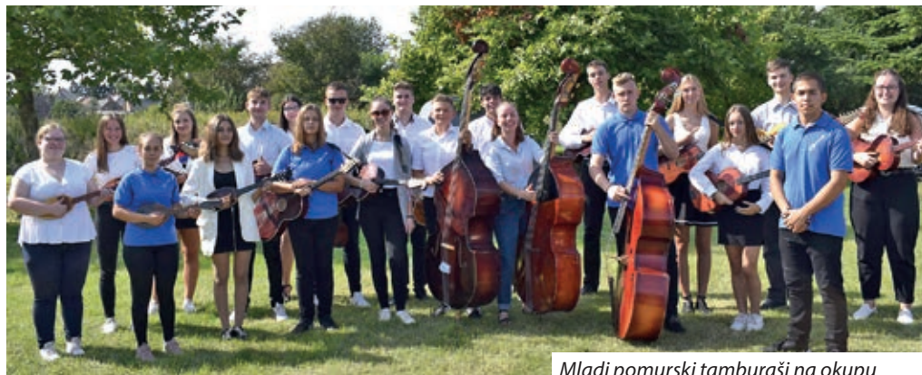
Mladi pomurski tamburaši na okupu