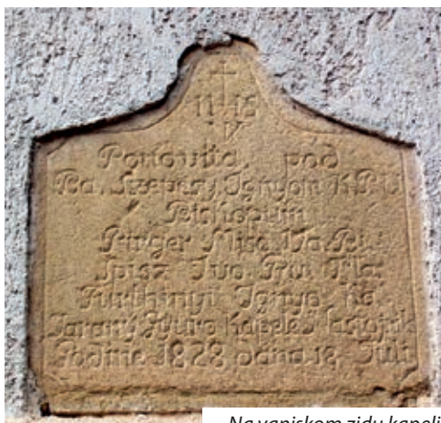
Na vanjskom zidu kapelice u Đukiću hrvatski tragovi