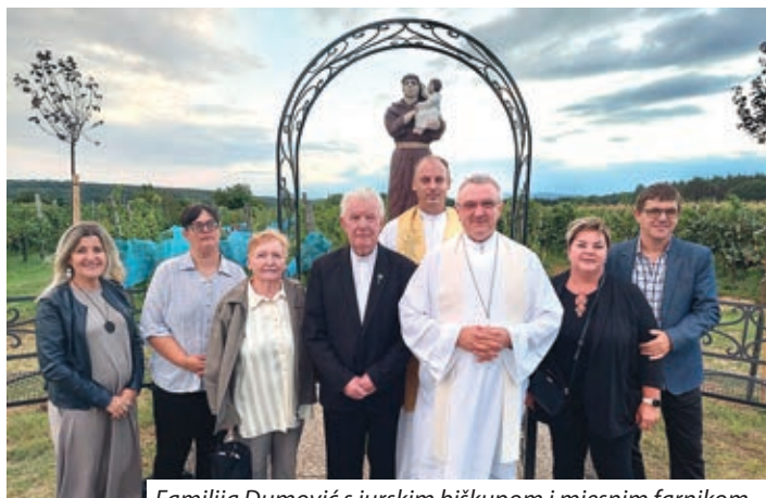
Familija Dumovič s jurskim biškupom i mjesnim farnikom