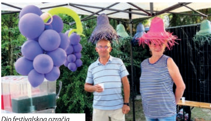
Dio festivalskog ozračja