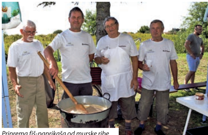
Priprema fiš-paprikaša od murske ribe

mouprave utemeljen je prije godinu dana, a na repertoaru uz pomurske pjesme već ima i hrvatsku zabavnu glazbu. Voditelj im je Erik Hegedüs. Pomladak ka-