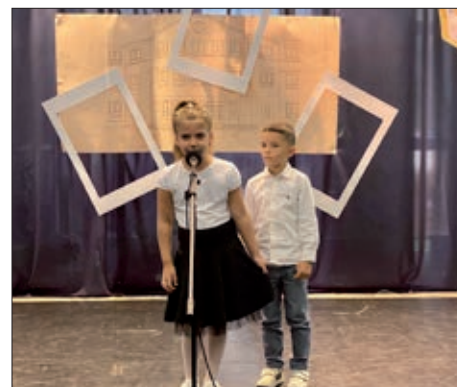
U budimpeštanskom HOŠIG-u