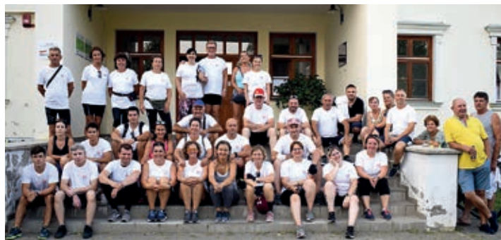
Ispred Fedakove kurije, u kojoj je smješten i Hrvatski kulturno-prosvjetni zavod „Stipan Blažetin“

Hrvatska državna samouprava još od 2015. organizira Biciklijadu „Cro Tour“ i iz godine u godinu na njoj sudjeluje oko 50 sudionika koji zapravo preko te sportske priredbe mogu upoznati brojne žitelje svih hrvatskih regija. Na taj način svi Hrvati u Mađarskoj povezuju se u jednu zajednicu.