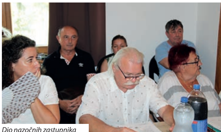
Dio nazočnih zastupnika

„Mate Meršić Miloradić“ u Sambotelu te Hrvatskom vrtiću, osnovnoj školi i učeničkom domu u Santovu, kao i o sažetku izvješća. U nastavku jednoglasno su usvojene i odluke o uvjetima davanja socijalne povlastice te o naknadi za topli obrok u trima odgojno-obrazovnim institucijama u održavanju Hrvatske državne samouprave.