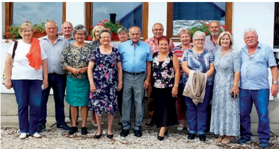
Priliku za ponovni susret iskoristilo je trinaest bivših učenika lukoviške škole, generacije 1962./63. – 1970./71.