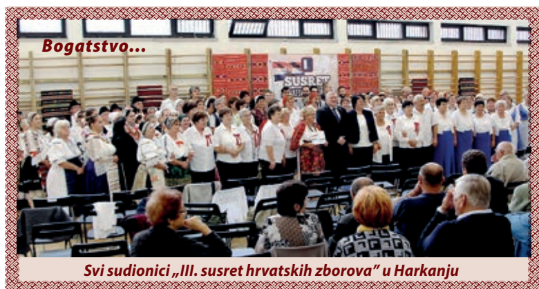
Svi sudionici „III. susret hrvatskih zborova“ u Harkanju