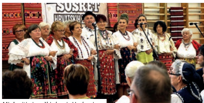
Mješoviti pjevački zbor iz Harkanja