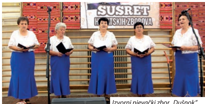
Izvorni pjevački zbor „Dušnok“