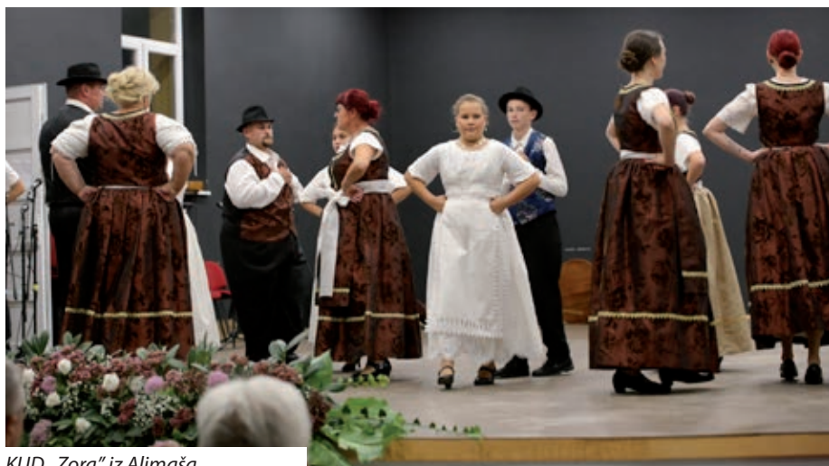
KUD „Zora“ iz Aljmaša