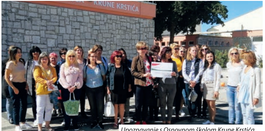
Upoznavanje s Osnovnom školom Krune Krstića

Po tradiciji na početku svake školske godine (osim za vrijeme pandemije) održava se usavršavanje za prosvjetne djelatnike hrvatskih narodnosnih škola kako bi dobili najaktualnije informacije, odnosno razmotrili razne nejasnoće u vezi s promjenama u aktualnoj školskoj godini. Kako je rekla ravnateljica pedagoškog i metodičkog centra Zsanett Vörös, program usavršavanja organizatori pokušaju sastaviti tako da dotaknu razne teme, da sudionici imaju vremena i za praktične vježbe, za raspravu, a i za druženja i izlete. Usavršavanje je otvorio predsjednik Hrvatske državne samouprave Ivan Guban i pozdravio sve sudionike te im zahvalio na njihovu višegodišnjem radu. Ista-