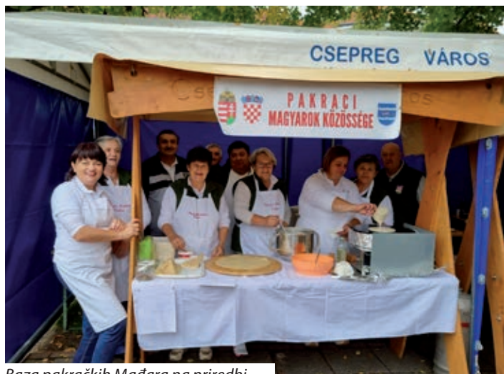
Baza pakračkih Mađara na priredbi