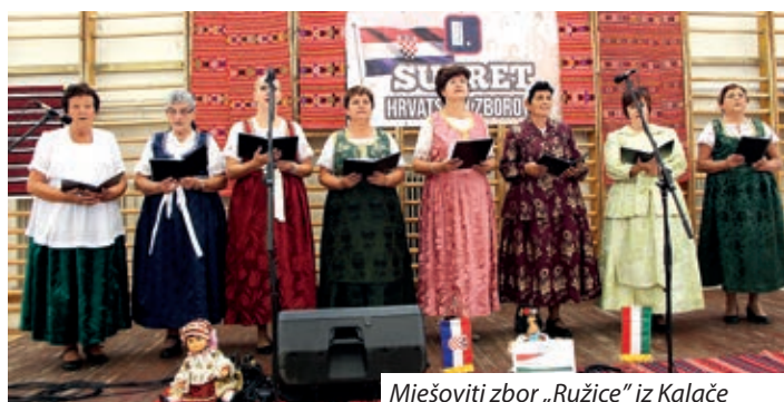
Mješoviti zbor „Ružice“ iz Kalače