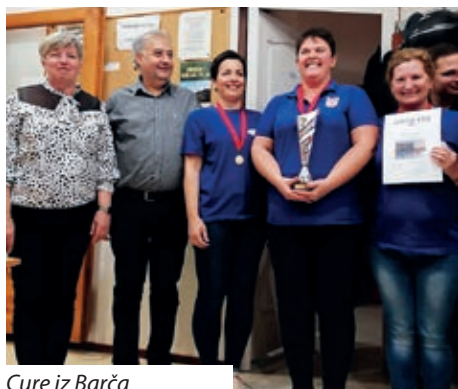
Cure iz Barča