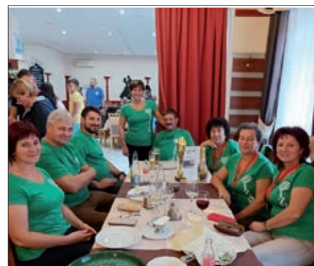
Kuglanje i „Susret ljubitelja folklor” 12. stranica