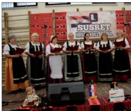
„III. susret hrvatskih zborova” 9. stranica