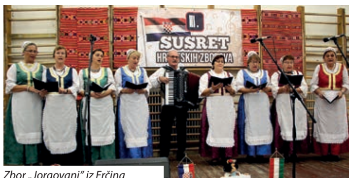
Zbor „Jorgovani“ iz Erčina