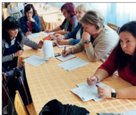
Usavršavanje nastavnika u matičnoj domovini 3. stranica