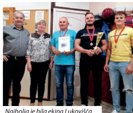
Najbolja je bila ekipa Lukovišća