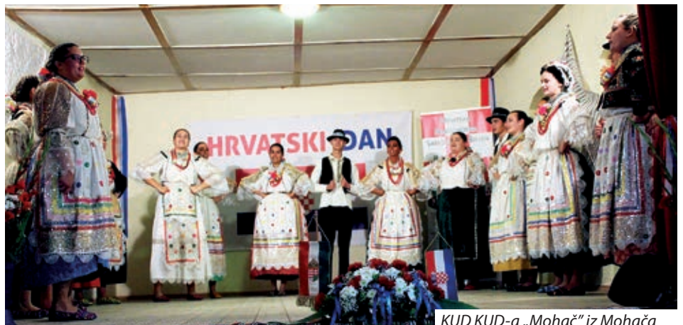
KUD KUD-a „Mohač“ iz Mohača

mouprave Birjana i članovi Hrvatske plesne grupe Birjana.