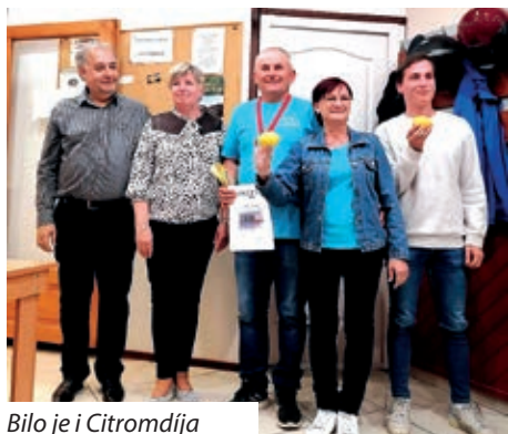
Bilo je i Citromdíja