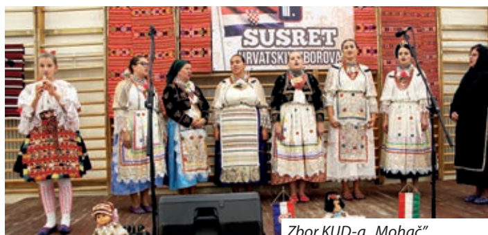
Zbor KUD-a „Mohač“

U organizaciji Hrvatske samouprave Harkanja u Harkanju je održan „III. susret hrvatskih zborova“. Susret je održan u sportskoj dvorani Osnovne škole „Pál Kitaibel“. Na susretu su sudjelovali sljedeći zborovi: ŽPZ „Snaše“ iz Pogana, Izvorni pjevački zbor „Dušnok“, Mješoviti zbor „Ružice“ iz Kalače, Zbor očuvanja narodnih pjesama iz Fičehaza („Hagyományörzö Nép dalkör“), zbor KUD-a „Mohač“, Zbor „Karašica“ iz Katolja, Zbor „Biser“ iz Kozara, Ženski pjevački zbor iz Kačmara, Zbor KUD-a „Ladislav Matušek“ iz Kuginja, Zbor „Jorgovani“ iz Erčina, Zbor „Komšije“ iz Tukulje, „Hrvatski zbor“ iz Kaniže, Mješoviti pjevački zbor iz Harkanja. Zborovi koji su sudjelovali na susretu mogli su za svoj nastup izabrati tri pjesme i trebali su biti odjeveni u narodnu nošnju svojeg kraja. Prigodnim riječima nazočnima su se obratili generalni konzul Drago Horvat te dogradonačelnica Harkanja Éva Dávid Hosszú, koja je izrazila radost što Harkanj može biti domaćinom tog važnog događanja. Dodala je kako je Mješoviti zbor harkanjskih Hrvata aktivan dionik svih kulturnih događanja u gradu i kako se gradsko vodstvo njime ponosi. Iskorištila je priliku i čestitala zboru na 20. obljetnici utemeljenja i djelovanja.