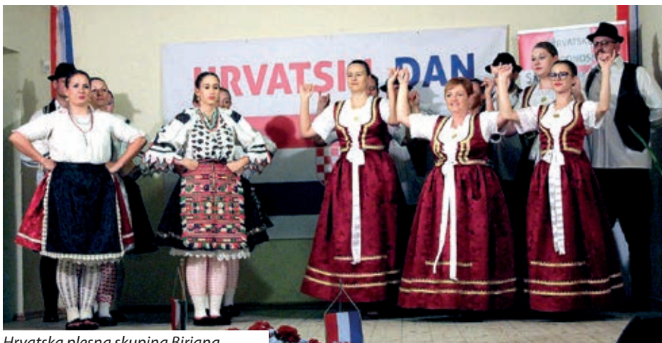
Hrvatska plesna skupina Birjana