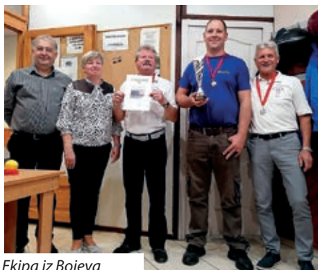
Ekipa iz Bojeva