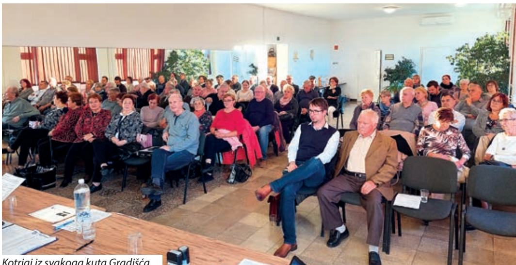
Kotrigr iz svakoga kuta Gradišća