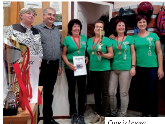
Cure iz Izvara