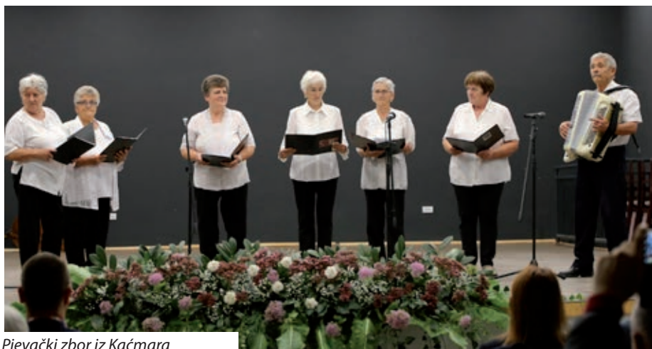
Pjevački zbor iz Kačmara