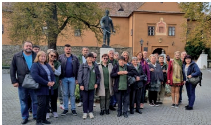
Pred kiseškom tvrđavom