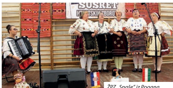
ŽPZ „Snaše“ iz Pogana